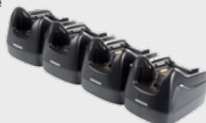
• 94A150037 Vierfach Lade-/Übertragungsstation • 94A150038 Vierfach Ethernet Station